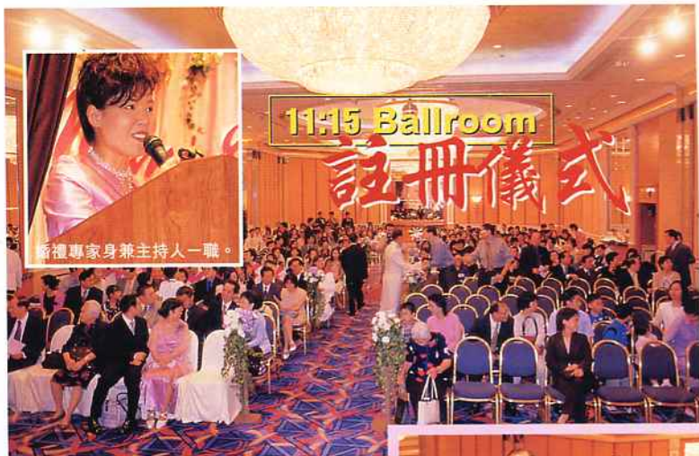
婚禮專家身兼主持人一職。