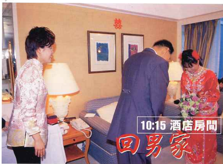
▲過門後，便要進行傳統的拜堂儀式，「一拜當天，二拜高堂，夫妻交拜。」。