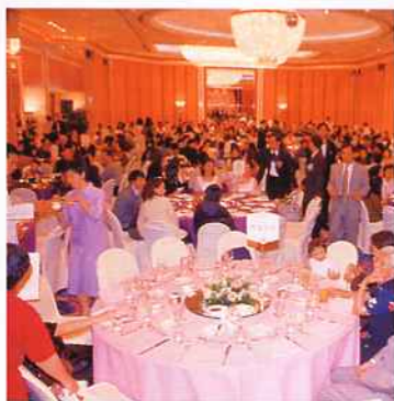
▲同一個宴會廳搖身一變而成午宴場地。