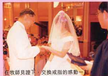
在牧師見證下，交換戒指的感動一刻。