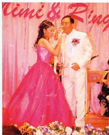
▲安裝於台側的肥皂泡機噴出「夢相成真」肥皂泡，為一直夢想的甜美婚姻揭開序幕。