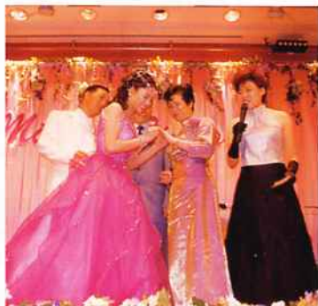
▲細心的新人，不忘送紀念品與至愛的父母親。