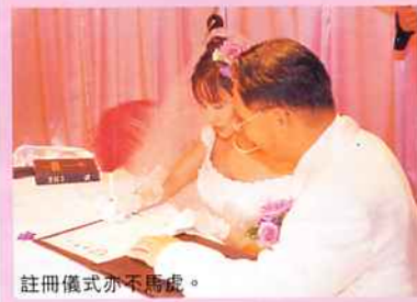
註冊儀式亦不馬虎。