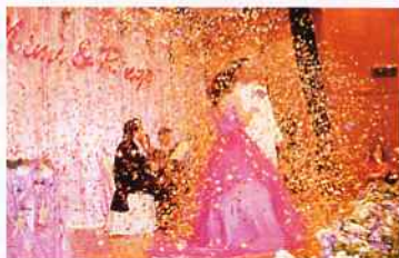
▲當新人熱吻至象徵長長久久的第九下時，巨型彩炮發放，象征未來生活充滿繽紛燦爛色彩。