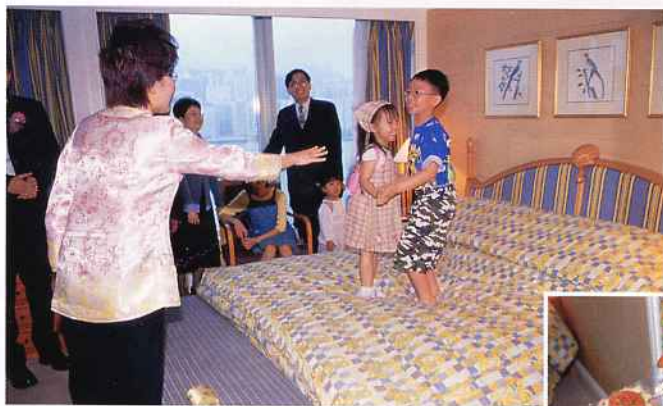
◀▼壓床儀式中，請來一男一女童子，有「好」的喻意。於床的四角各放一包喜果，望新人喜兆連連，快快添丁。