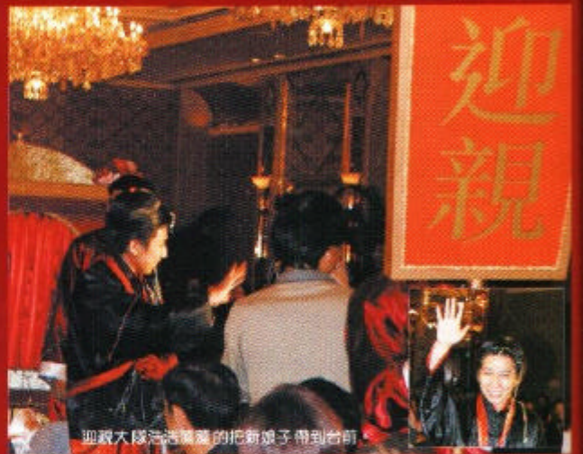
迎親大隊浩浩蕩蕩的把新娘子帶到台前。