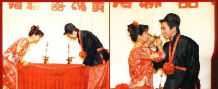
傳統的結婚儀式又怎可缺少夫妻交拜這一環？