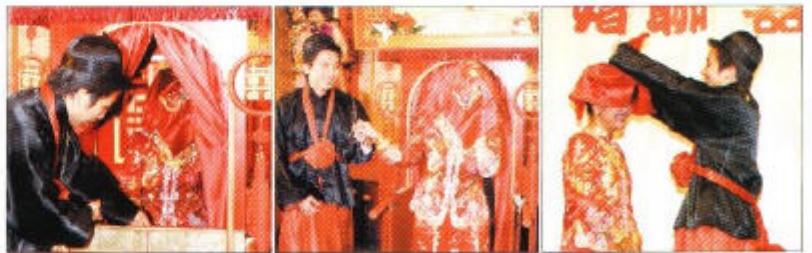
新郎親臨轎門，從轎中走出來的新娘子一臉嬌羞之情。