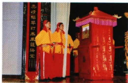
迎親花轎+鳳冠霞珮

重點 新人花轎迎親，新娘戴上鳳冠，身穿霞珮，新郎過轎門，古老當時興，盡顯威風排場！